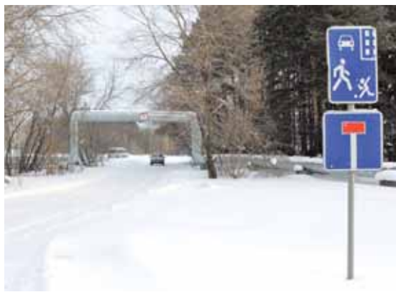
На фото: пока дороги от Соснового бульвара до Кузбасского проспекта просто нет.

Всеми любимым бульвар Строителей станет длиннее на 1,3 километра. Его протянут от улицы Марковцева до самой улицы Северной на Металлплощадке. Это и так была самая протяженная прогулочная зона – около 3 километров. Теперь же, двигаясь вверх по уникальной улице, недавно отметившей 50-летие, можно будет выйти за границы нашего города и добраться до соседнего поселка! Правда, продолжение бульвара будет иметь иную конфигурацию. Основная дорога будет четырехполосной, разделенной островком безопасности шириной 5,5 метра. Вдоль нее проложат шестиметровые тротуары с выделенными зонами для велосипедистов и пешеходов с ограниченными возможностями здоровья. А вдоль сегодняшней зоны застройки пройдет дорога-дублер, обеспечивающая подъезд к жилым домам. Примерно в районе дома 63 на Строителей дороги сомкнутся и образуют одну современную магистраль, по которой в будущем возможен запуск общественного транспорта – троллейбусной линии с разворотным кольцом. Важно понимать, что эта часть бульвара всё-таки не будет прогулочной, поскольку здесь проходят многие важные городские коммуникации. Это скорее инженерно-транспортный коридор.