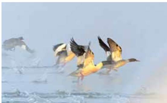
Большие крохали (фото слева) и гоголи (фото справа) в городской черте встречаются повсеместно.

Марина ТУМАНОВА.