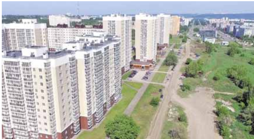
На фото: скоро бульвар Строителей прирастёт новым участком современной и комфортной дороги.