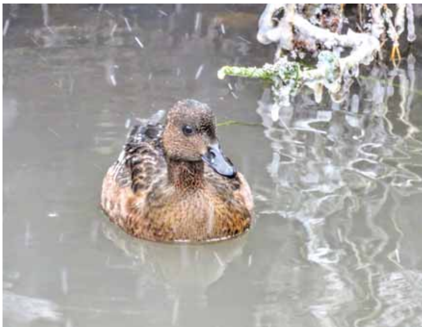
На пригородных водоёмах Кемерова можно встретить небольшую утку-свиазь.

питания, ест буквально всё: от ряски, злаков, даже клубней растений до насекомых, моллюсков, мелких беспозвоночных, рыбы и лягушек, а бывали даже случаи, когда кряквы кушали и сво-