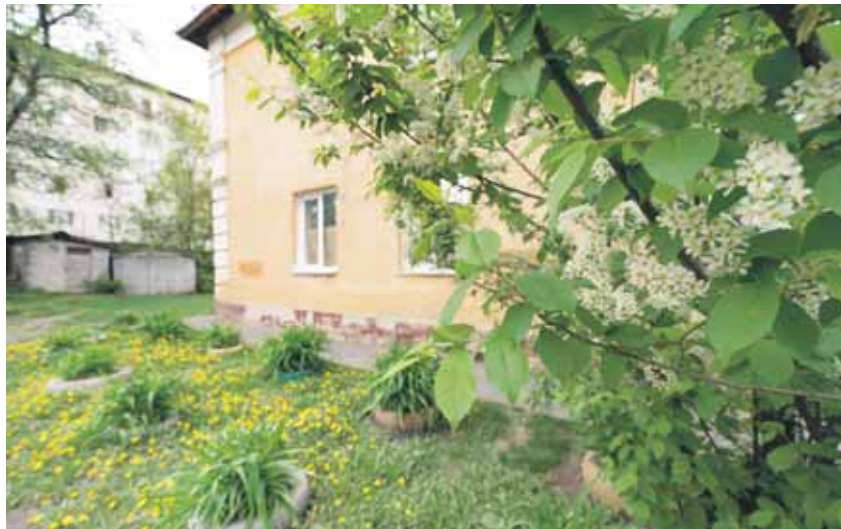
Оба дома буквально утопают в зелени и цветах.

Как отмечает наш эксперт Ирина Захарова , вполне могло быть такое, что на короткий промежуток времени в силу острой