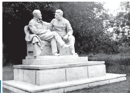
Скульптура «В.И. Ленин и И.В. Сталин в Горках» в мини-сквере на Кирова, 1950-е.

Вопрос, для кого именно строили дома и что за люди были их первыми новоселами, обернулся в наших исследованиях, пожалуй, самым большим сюрпризом. Центр Кемерова в районе Советского проспекта, улиц Кирова и Островского в конце 40-х – начале 50-х застраивали самые разные предприятия: НКХК (будущий «Азот»), ГРЭС, КЭМЗ, АТЗ, заводы «Руда», «Карболит»... Логика подсказывала, что и эти два неприятных домика принадлежат кому-то из промышленников. Ан нет.