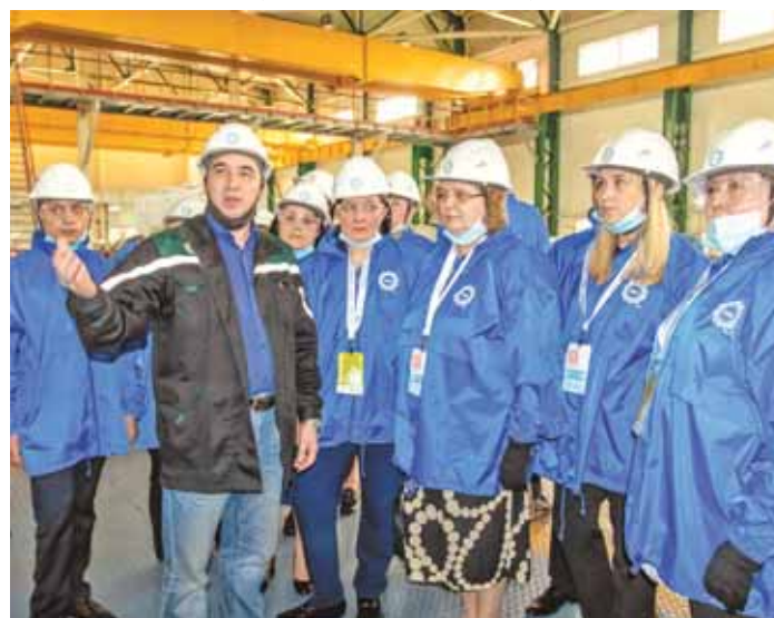
Участники форума посетили промышленную площадку ПАО «Кокс».

ки карьерных и шахтных вод, с развитием экономитории, деятельностью общественных организаций, экологическим воспитанием и образованием детей