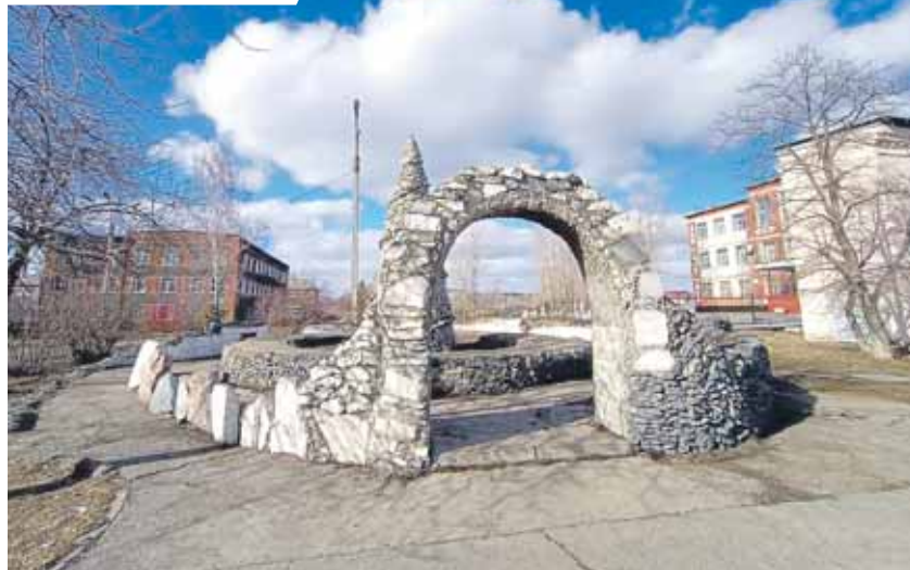
Сквер напротив школы № 52 может получить путевку в новую жизнь в 2022 году – выбор за горожанами!