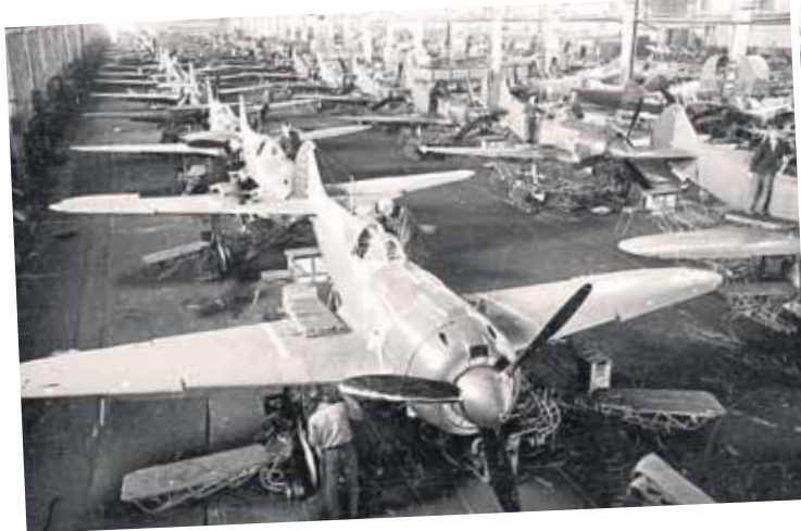
Более миллиона рублей собрали коксохимики для строительства авиационной эскадрильи.

Не хватит и целого номера газеты «Кемерово», чтобы рассказать обо всех боевых подвигах, которые