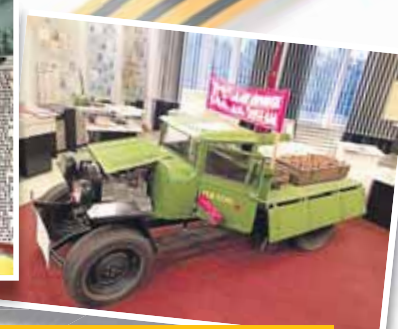
Память о подвиге заводчан не угаснет – её бережно хранит музей Кемеровского механического завода. Пока живы потомки героев и бьётся сердце предприятия – никто не будет забыт.

ной. Их места у станков заняли выпускники ремесленных училищ, 15-16-летние мальчишки и девчонки, женщины, проводившие на войну своих отцов, братьев и мужей. Они трудились, не жалея себя, обеспечивая наших воинов боеприпасами. Мехзаводчане встретили и приняли в свои семьи эвакуированных из Ногинска коллег-заводчан. До самого конца войны жили и работали как одна дружная большая семья. Медалями «За доблестный труд в Великой Оте-