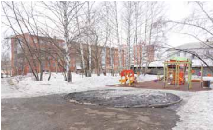
На фото: сквер за зданием территориального управления Рудничного района.