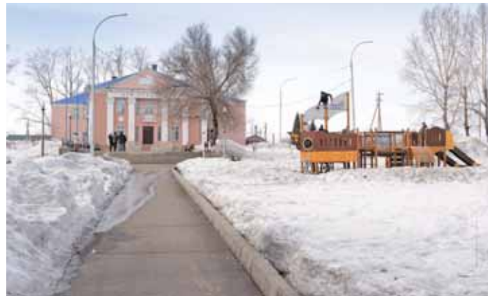
На фото: сквер на территории, прилегающей к Дворцу культуры в поселке Боровой.

Жители старейшего района Кемерова совсем скоро смогут решить судьбу двух важных общественных пространств на правом берегу Томи, приняв участие в голосовании по выбору территорий для реновации в 2022 году. Оно стартует совсем скоро – 26 апреля – и продлится до 30 мая.