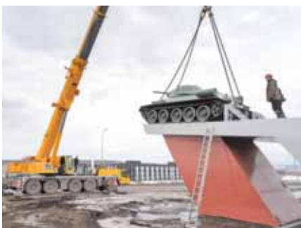
Символ Победы готовится к 9 Мая.

6 апреля с постаментов на кольцевой развязке возле Президентского кадетского училища сняли танк Т-34. Боевая машина, которую называют символом Победы, отправилась на «Азот». В цехах завода легендарный Т-34 готовят к участию в проходе торжественным маршем в честь Дня Победы. К