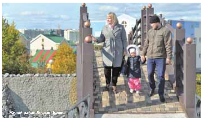
Жилой район Лесная Поляна