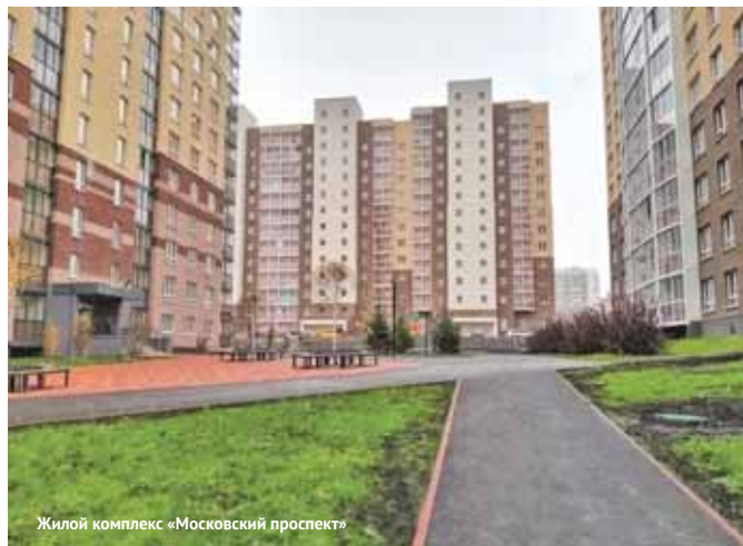
Жилой комплекс «Московский проспект»

барачного поселка шахты «Северная». Эта территория осваивается с 2013 года. Всего жилой комплекс будет состоять из 11 домов, 8 из них уже построены, квартиры по соцпрограммам в них получили 884 семьи. В декабре 2021 года будет завершено возведение еще одного 126-квартирного дома. Еще по двум получено положительное заключение экспертизы – а значит, скоро в микрорайоне закипят очередные стройки.