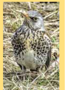
...и встречаются птицы: