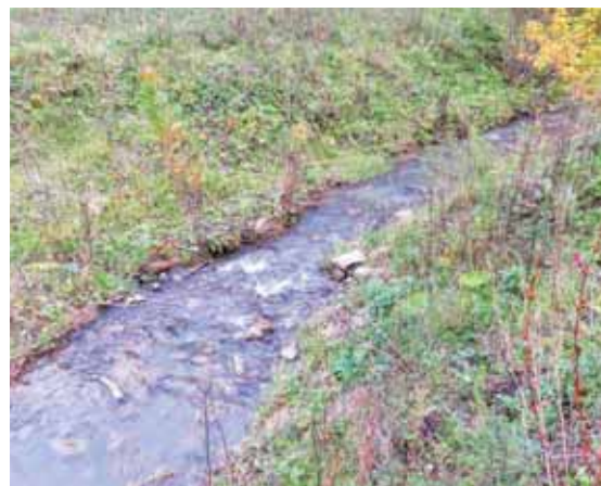
На фото: ближе к улице Терешковой по левой стороне бора журчит-шумит маленькая речка Каменушка.

Ближе к улице Терешковой по левой стороне бора журчит-шумит маленькая речка Каменушка. Начало она берет из подземного источника в районе Серебряного бора, несетя мимо обширного участка, через лес и, как и многочисленные речки-сестренки, питает Томь.