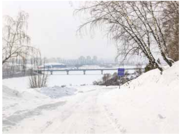
На фото: красивые и живописны не только пейзажи самого бора, но и виды, открывающиеся из него.

цветущим пестрым разнотравьем. Злаки и обилие лесного горошка перемешались с лекарственными кровохлебкой, тысячелистником и чистотелом. Лесная земляника играет в прятки среди скромных кустиков герани, цветочков лютиков и фиалок... Всего не перечислишь. Только и начинай считать и примечать, когда вслед за первоцветами лужайки и поляночки бора покроются пестрыми цветочными коврами.