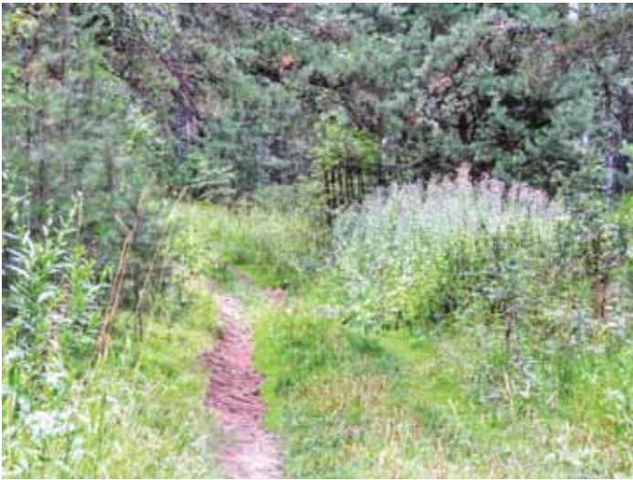
На фото: летом луга у восточной границы Красного бора покрыты цветущим пестрым разнотравьем.