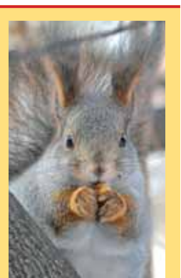
В Красном бору живут звери:

...Такой он – наш Красный бор, биологически разнообразный, удивительный. Красочный и живописный в теплые сезоны, умиротворенный – в снежные. Естественный и дикий, он живет в гармонии с нашим городом. Радует свежестью своих лугов, лесной прохладой, журчанием реки. Рассказывает об эпохах намного более отдаленных... эпохах начала времен. К