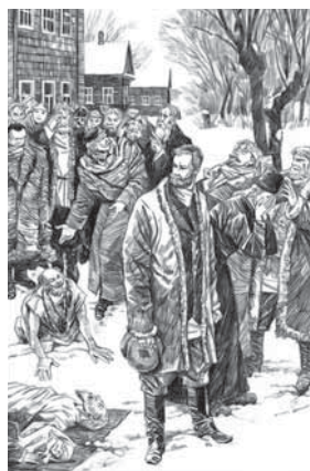
Иллюстрация к книге «Перед концом света» (художник И. Сакуров).

По приезде на русский Север Фандорин знакомится с главным уездным статистиком Алоизием Степановичем Кохановским, который сразу вызывает симпатию у читателей своей открытостью, воодушевленностью, безграничной преданностью избранному когда-то нелегкому делу. Что же говорит о переписи уездный статистик?